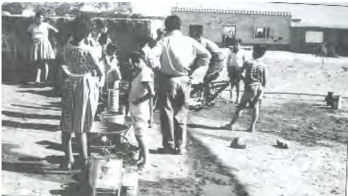
Imagen N° 1: vecinos/as del Barrio San Martín luego de la conexión de agua fuera de la ley.