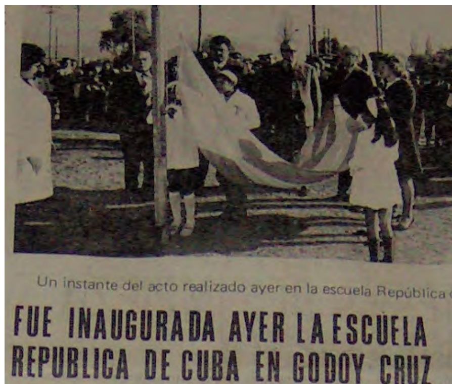
Imagen N° 5: La escuela del barrio Virgen del Valle.

Otra característica sobresaliente de la estrategia atañe al criterio que orientaba la construcción de organización, lo cual operaba también como condición de posibilidad para su continuidad en el tiempo: la definición colectiva de necesidades comunes . Existían distintos ámbitos de participación que se organizaban en torno a temáticas o problemas específicos (como ilustra la tabla 1). Cada ámbito era asumido por grupos de trabajo con sus responsables donde participaban, además, militantes que no residían en el barrio pero eran parte de la organización. Luego, los/as responsables confluían en una “comisión directiva”. Finalmente, se encontraba la asamblea general como instancia de participación y de toma de decisiones del conjunto de los/as vecinos/as.