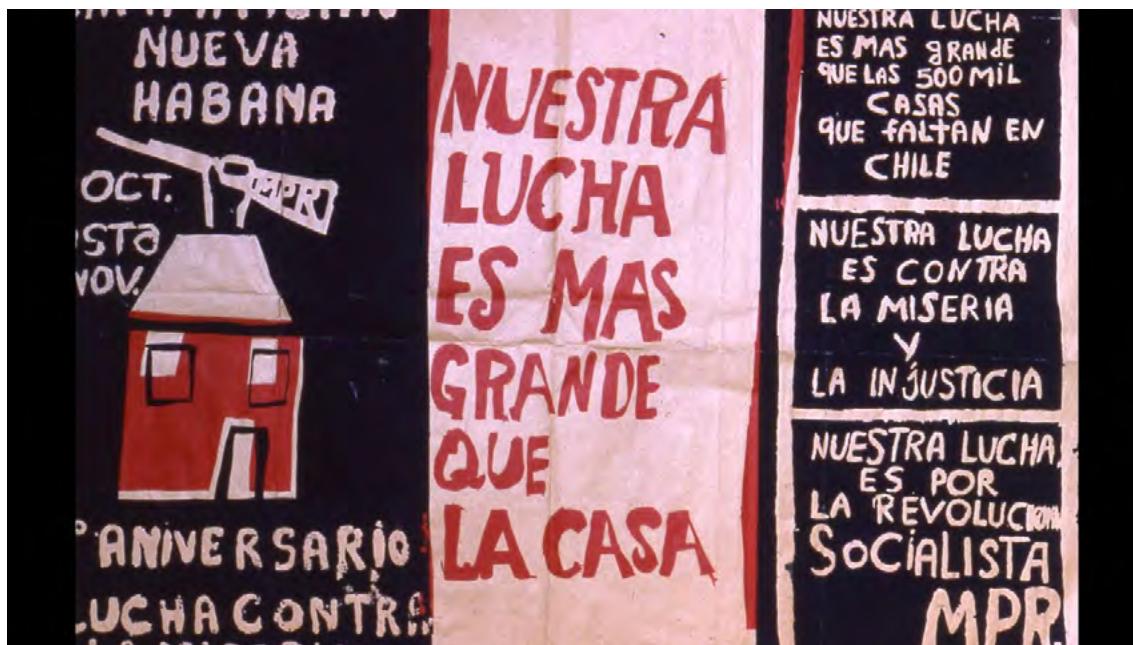
Imagen N° 4: afiche del Campamento Nueva Habana fundado en noviembre de 1970, orientado por el MIR.

La configuración de la lucha reivindicativa como “frente” de la lucha política de clases, era para Pastrana y Threlfall (1974) uno de los rasgos principales del “modelo político y organizativo movilizador” donde incluyen a las experiencias lideradas por el MIR y algunos campamentos con inserción del Partido Socialista (PS) (pp. 69-70).