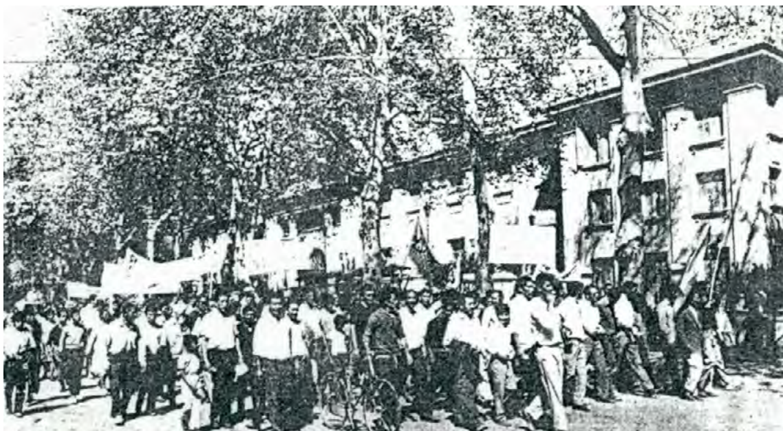
Imagen N° 3: Manifestación Este es nuestro Carrusel pasando frente al entonces Plaza Hotel y el Teatro Independencia.

A comienzos de 1971 la militancia impulsaba la construcción de una herramienta de articulación inter-barrial. Aunque no prosperaría en sus objetivos, desde esta instancia el B° Virgen del Valle confluyó con otros del oeste, como el B° San Martín, en dos acciones importantes. En primer lugar, una movilización ese mismo año con motivo de otro aluvión, que nuevamente afectó a los asentamientos y barrios populares de la periferia. Distribuyendo un comunicado en el que se identificaban como trabajadores/as , los/as vecinos/as recorrieron el circuito céntrico del tradicional carrusel de la “Fiesta Nacional de la Vendimia”, portando un carro destartalado que simbolizaba la desigualdad y la precariedad de sus vidas. Al grito de “este es nuestro carrusel” –exigiendo vivienda, defensas aluvionales y trabajo– aparecieron organizadamente en la escena pública como sector , provocando efectos urbanos y políticos considerables (Baraldo 2006).